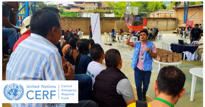
Los Coordinadores Humanitarios AICMA trabajarán para apoyar en el cumplimiento del Plan de Respuesta Humanitaria (HRP) definido anualmente por todas las organizaciones AICMA que forman parte del Área de Responsabilidad de Acción Contra Minas en Colombia.

El Fondo Central de Respuesta a Emergencias (CERF, por sus siglas en Inglés) de las Naciones Unidas aprobó el desembolso de 6,5 millones de dólares para financiar diversos proyectos que serán implementados por ocho oficinas del sistema ONU en Colombia a partir de junio de este año, en áreas como seguridad alimentaria, protección de la niñez y acción contra minas antipersonal.